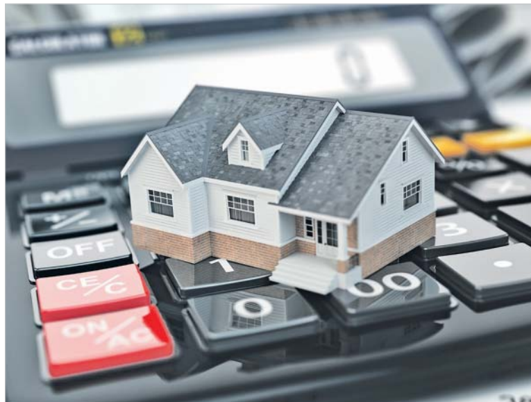
Владельцам электронного профсоюзного билета подсказут, какой банк подходит для рефинансирования кредита

Далее нужно было предоставить документы: паспорт,