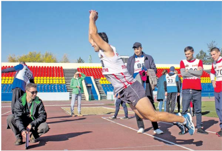
Прыжок в длину с места с толчком двумя ногами — одно из упражнений комплекса ГТО

Второе место на пьедестале почета заняли работники ЧУЗ «Клиническая больница «РЖД-Медицина» города Омска, третье — у Омской дистанции гражданских сооружений.