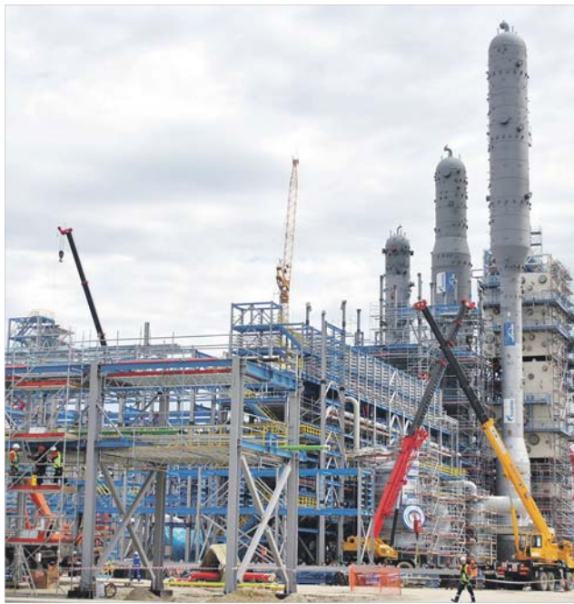
Запуск Амурского ГПЗ может лишить железнодорожные предприятия работников

Сегодня на дороге создано 34 таких клуба. Но этого не достаточно. Ведь есть еще резервы. От работо-