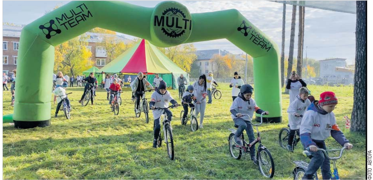
Для детей подготовили укороченную трассу — 2,5 км

ИРИНА ТОКАРЕВА, Дорпрофжел на СвЖД ЕКАТЕРИНБУРГ