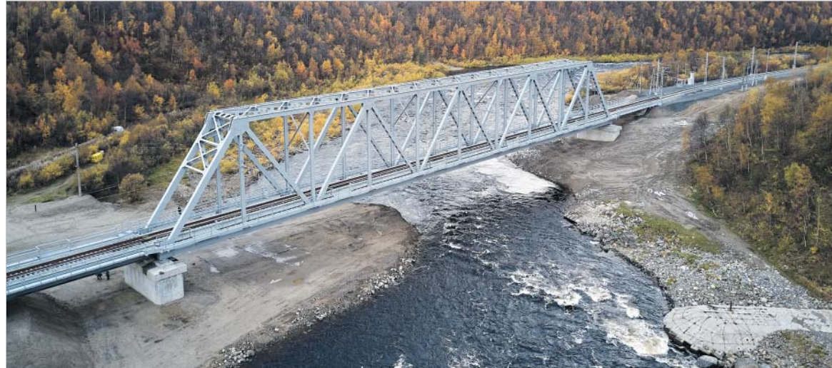
Мост возвели в рекордно короткие сроки — всего за 105 дней

зывают уникальным. В отличие от старого, он не имеет опор, установленных в русле реки, все опоры являются береговыми. Это исключает воздействие на мост паводковых вод. Кроме того, это хорошо и рыбе, которая мигрирует через Колу — опоры не мешают ее продвижению.